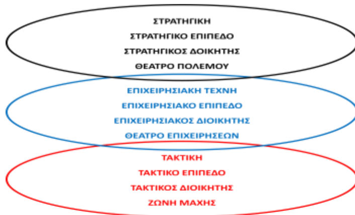
Εικόνα 1. Τα επίπεδα του πολέμου

Η ανάλυσή μας θα ξεκινήσει με την εξέταση των όρων εκστρατεία , θέατρο πολέμου , κύρια επιχείρηση , θέατρο επιχειρήσεων και μάχη , με παράλληλες αναφορές στην ιστορική εξέλιξη των όρων και του τρόπου άσκησης της στρατηγικής, από την άποψη της σχέσης της με τους ανωτέρω όρους· θα εξετάσουμε ακροθιγώς τις αλλαγές που επήλθαν μετά τους Ναπολεόντειους πολέμους, την εμφάνιση του όρου επιχειρησιακή τέχνη και το επακόλουθο επιχειρησιακό επίπεδο πολέμου και τέλος την ερμηνεία του όρου όπως χρησιμοποιείται σήμερα· τέλος θα παρουσιασθεί η επιχειρηματολογία υπέρ και εναντίον της ύπαρξής του ως ανεξαρτήτου επιπέδου του πολέμου. Επίσης, θα καταβληθεί προσπάθεια προσαρμογής των εννοιών αυτών στα ελληνικά δεδομένα και θα εξετασθεί κυρίως αν αυτές συνάδουν με την ελληνική στρατιωτική σκέψη και τον (όποιο) ελληνικό τρόπο πολέμου.